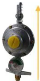
Regulador de Gás ALIANÇA - 2kg/h com Manômetro - GLP - Ref. 01738 ( https://www.gascenter.com.br/gas/regulador-alianca-2kg-blister-5061-btm )

( https://www.gascenter.com.br/gas/regulador-alianca-2kg-blister-5061-btm )